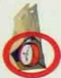
ЗВУК ЧАСОВОГО МЕХАНИЗМА