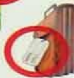
БЕСХОЗНЫЕ СУМКИ, ПОРТФЕЛИ, ПАКЕТЫ